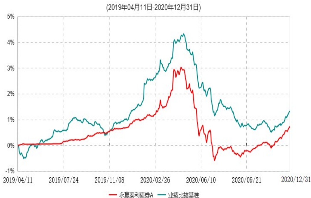
永赢泰利债券A累计净值增长率与业绩比较基准收益率历史走势对比图