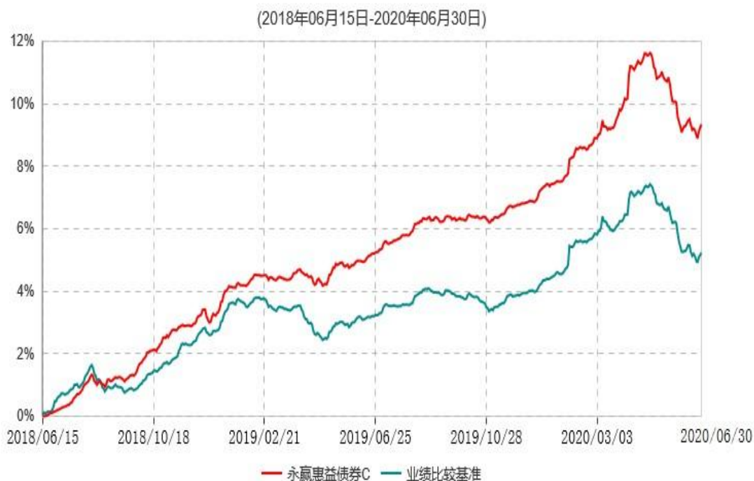
永赢惠益债券C累计净值增长率与业绩比较基准收益率历史走势对比图